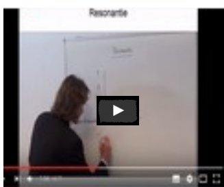
Het verschijnsel resonantie in de fysica is ook op psychologisch en spiritueel vlak van toepassing

Dit is mogelijk dankzij de werking van het chloroplast in de celkern, dat we kunnen zien als een zonnecollector. Deze zet de fotonen om in biofotonen en geeft ze door aan het DNA. De zonne-energie wordt dus gesublimeerd tot bio-energie.