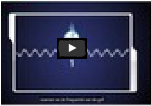
Basisuitleg over het elektromagnetisch spectrum en straling

Het enige wat we kunnen doen is de verhalen blijven vertellen