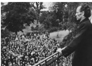
Door duizenden mensen bijgewoonde toespraken aan de Traberhof