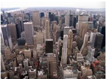
New York, perfect voorbeeld van een onleefbare stad (Jaap Kruit-hof, 1985)

Een uitgebreide historische schets van de oorzaak van alle problemen vindt u op: www.lucvanoost.be