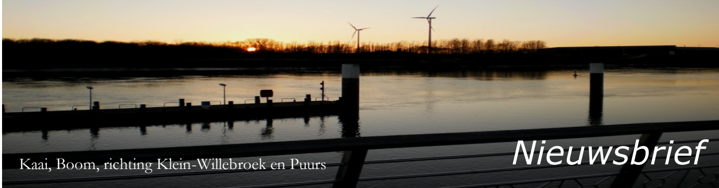
Kaai, Boom, richting Klein-Willebroek en Puurs