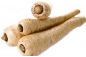
Pastinaak, een lekkernij

Percentage conserven dat de veiligheidsmarge overschrijdt met een factor 5 tot 100 per serving (klik voor vergroting)