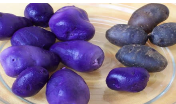
Vitelotte, de violette aardappel, ook truffelaardappel genoemd